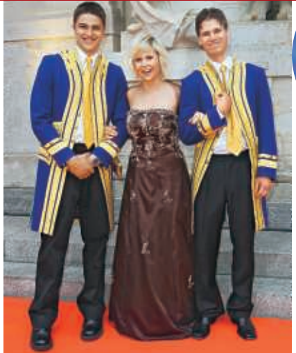
Majestätisch? Schauspielerin Michaela Schaffrath (37) mit Dienern