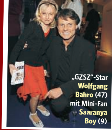
„GZSZ“-Star Wolfgang Bahro (47) mit Mini-Fan Saaranya Boy (9)